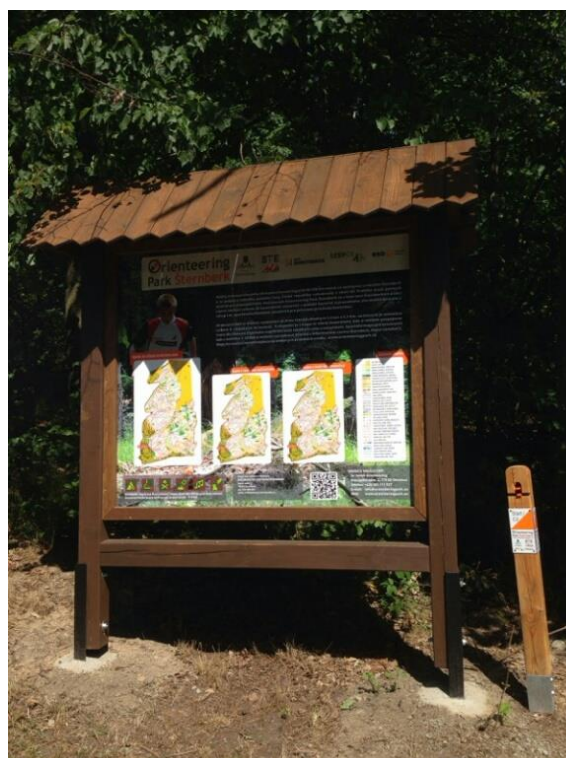
Obrázek 4 – informační tabule OP Šternberk

Největším nebezpečím pro APK jsou nepochopitelné projevy vandalizmu. Z tohoto důvodu byly uzavřeny 3 areály, ostatní se daří udržovat s přijatelnými náklady.