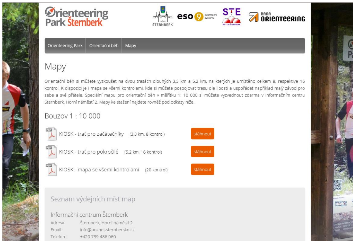
Obrázek 4 – ukázka webové stránky OP Šternberk http://www.orienteringpark.cz/sternberk/

Z webové stránky vybraného areálu získá zájemce informace o výdejních místech map se zakreslenými kontrolními stanovišti, případně možnosti tisku. Součástí webové stránky jsou zpravidla i stručné rady, jak mapu správně pochopit.